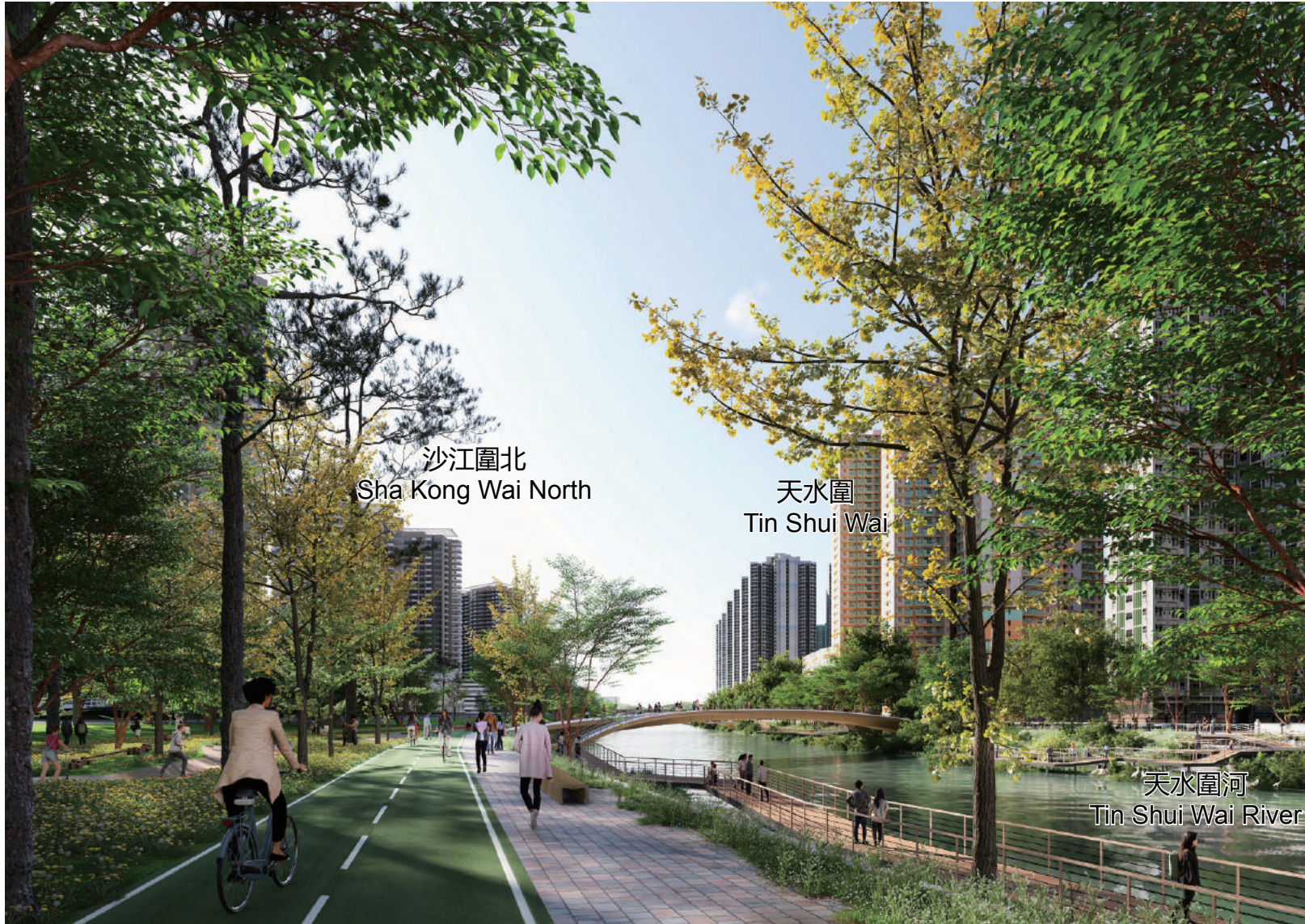
僅供說明的構想圖 Artist's impression for illustrative purpose only