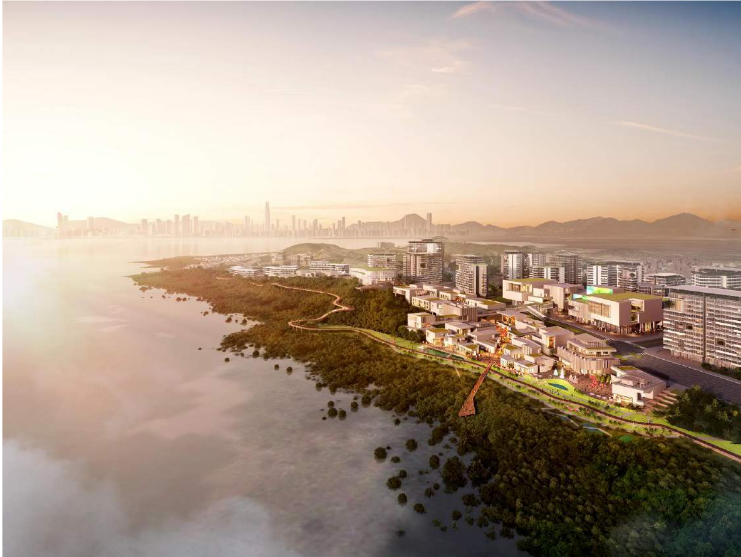
僅供說明的構想圖 Artist's impression for illustrative purpose only