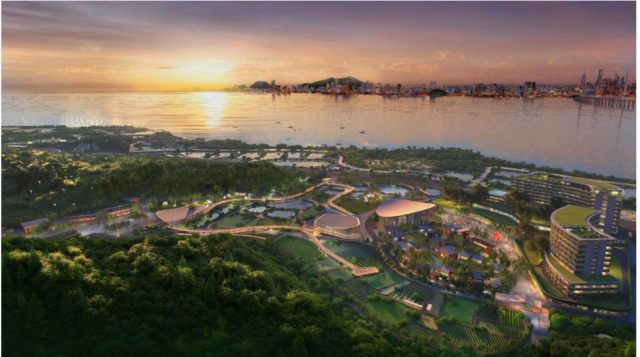
僅供說明的構想圖 Artist's impression for illustrative purpose only